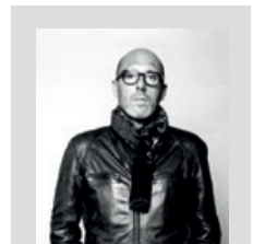
STIKS Designed in Paris by Christophe Pillet www.christophepillet.com

Encimeras: están disponibles con una amplia gama de materiales y acabados.