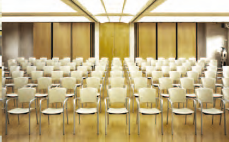
Hotel Olympic Auditorium Lloret de Mar Spain