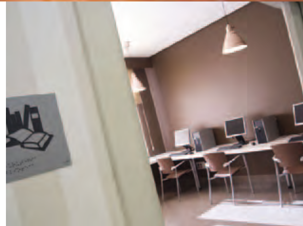
Beurko - Vitalitas Bilbao Spain