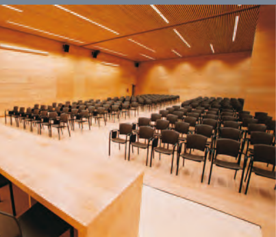
Putrajaya Centre Kuala Lumpur