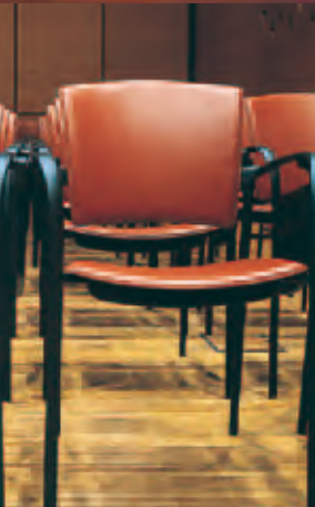
Euskalduna Jauregia Convention Centre Bilbao Spain