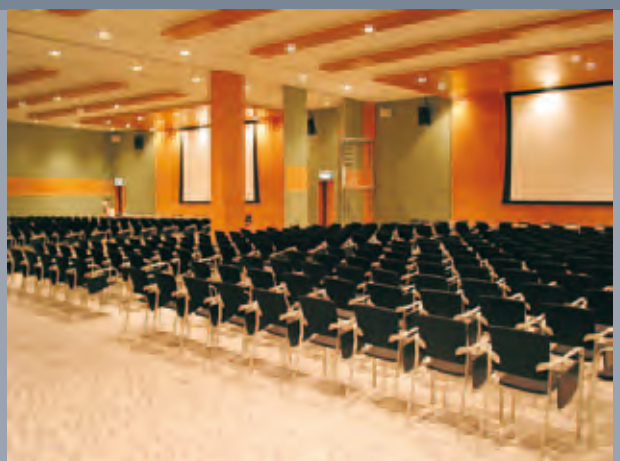
Málaga Convention Centre Spain